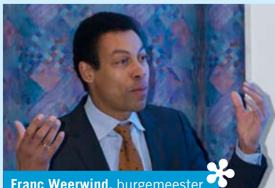
Franc Weerwind , burgemeester van de gemeente Velsen

“In Nederland mogen mensen in verhouding tot andere landen weinig kiezen. Burgerparticipatie kan daarvoor een alternatief zijn. Maar dan gaat het wel om vormen van burgerparticipatie waarbij burgers zichzelf besturen. Dat moet dus eigenlijk op afstand van het politieke bestuur gebeuren. Met een grote mate van vrijheid, waarbij de uitkomsten gevarieerd en verschillend mogen zijn. Maar veel politieke bestuurders hebben behoefte aan kaderstelling. Mijn interpretatie van kaderstelling is: ‘ze mogen best meedoen, maar wel op onze voorwaarden’. Als de overheid zo met burgerparticipatie omgaat, dan is het geen echte burgerparticipatie. Burgerparticipatie valt pas serieus te nemen als de uitkomsten ook worden aanvaard als deze de politiek en de bestuurders niet bevallen.”