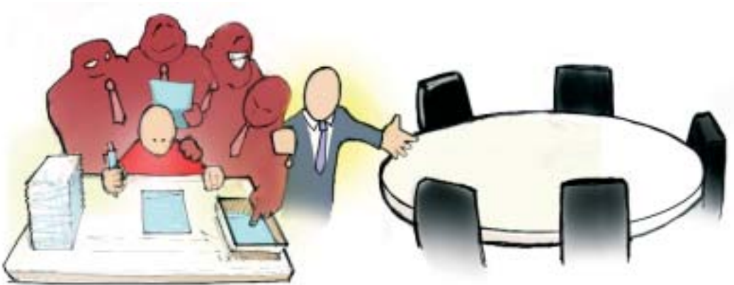
Regisseren is verleiden

“Het is maar de vraag of expliciete instrumenten (zoals een aanwijzingsbevoegdheid of meer middelen) partijen die echt niet willen of kunnen, over de streep trekken. De impliciete instrumenten van de gemeente zouden wel eens sterker kunnen blijken dan de expliciete. 4 ”