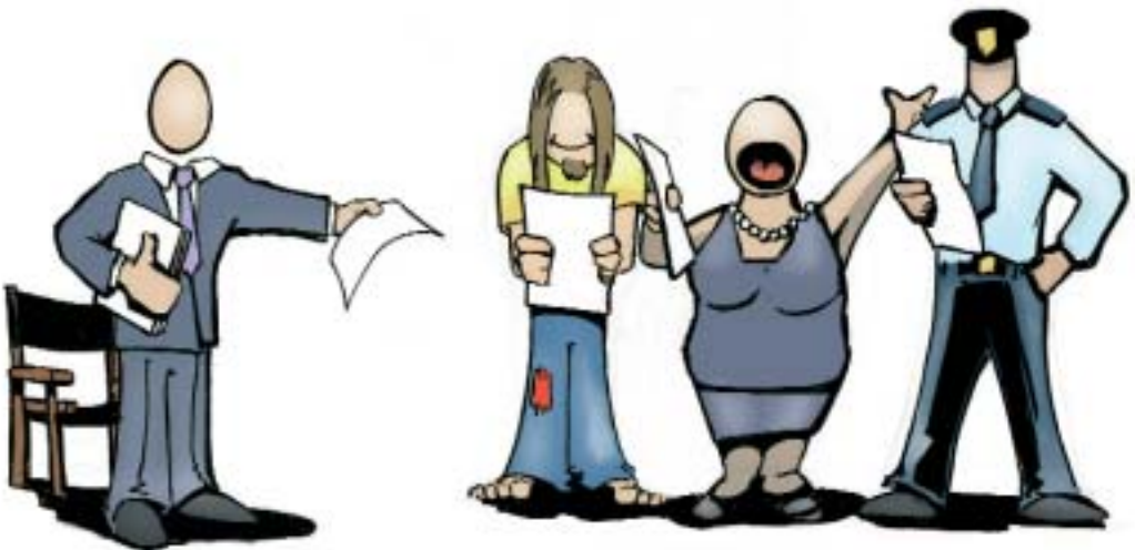
Verschillende actoren vragen om verschillende tactieken van de regisseur

In gesprekken met gemeenteambtenaren, werd nogal eens naar voor gebracht dat het onderscheid van Partners + Pröpfer louter theoretisch is en in de praktijk nauwelijks van betekenis zou zijn. Daarbij past wel een nuancering. De verschillende regietypen vragen alle om een verschillende opstelling van gemeente naar haar partners. Die opstelling varieert naargelang de verschillende gradaties van doorzettingsmacht die een gemeente heeft. Op het terrein van jeugd en veiligheid bijvoorbeeld heeft een gemeente te maken met een veelheid aan partners, zoals politie, openbaar ministerie, bureau Jeugdzorg, bureau Halt, scholen, welzijnsinstellingen en ook bedrijven. Als het gaat om doorzettingsmacht, neemt een gemeente verschillende posities in naar de verschillende actoren. Zo zal een gemeente vanwege een bepaalde subsidierelatie meer doorzettingsmacht hebben naar het welzijnswerk in haar gemeente dan bijvoorbeeld naar het onderwijs of naar politie. Een gemeente moet dus voortdurend schakelen tussen de verschillende posities die zij inneemt tegenover relevante partners en haar tactiek voor de wijze waarop zij haar regierol oppakt voor iedere partij afzonderlijk bepalen. Het onderscheid in regietypen maakt dus voor een gemeente inzichtelijk wat haar bevoegdheden en speelruimte zijn naar andere partijen en welke tactiek zij kan hanteren om de medewerking van andere partijen te verkrijgen.